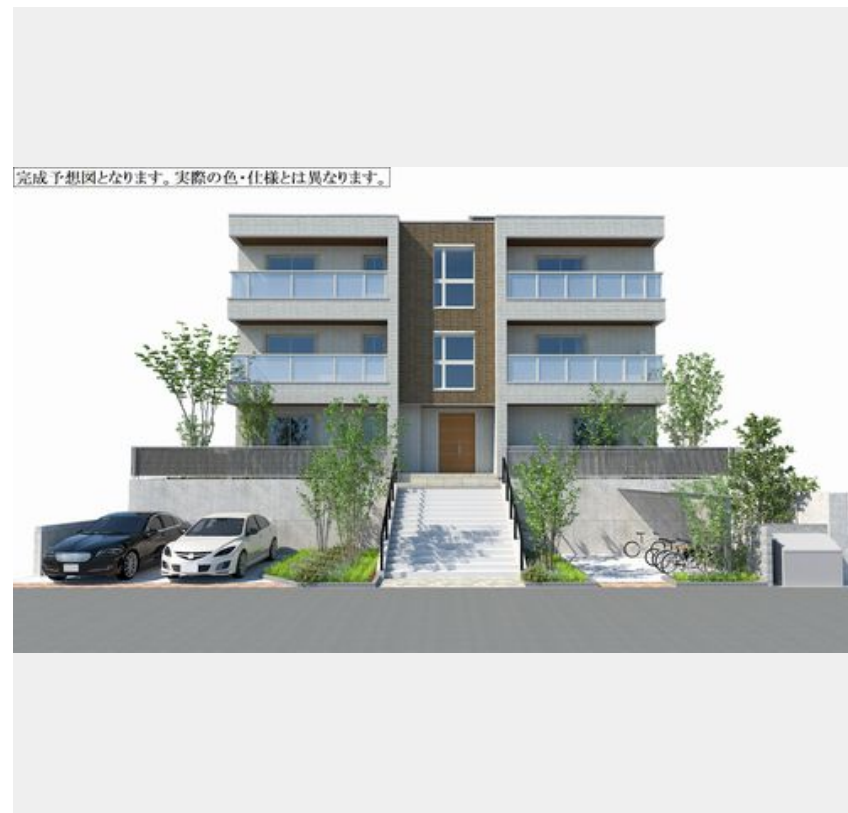
完成予想図となります。実際の色・仕様とは異なります。