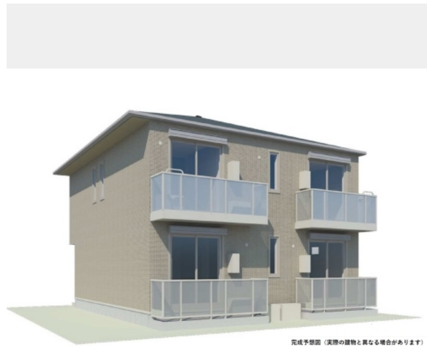
完成予想図（実際の建物と異なる場合があります）