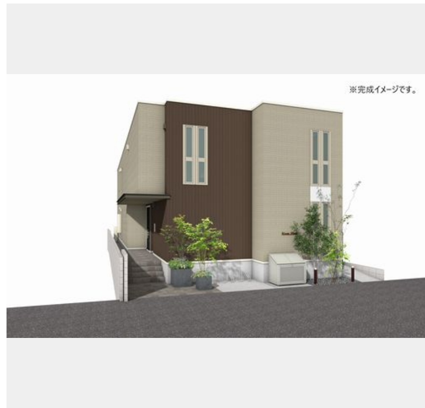
※完成イメージです。