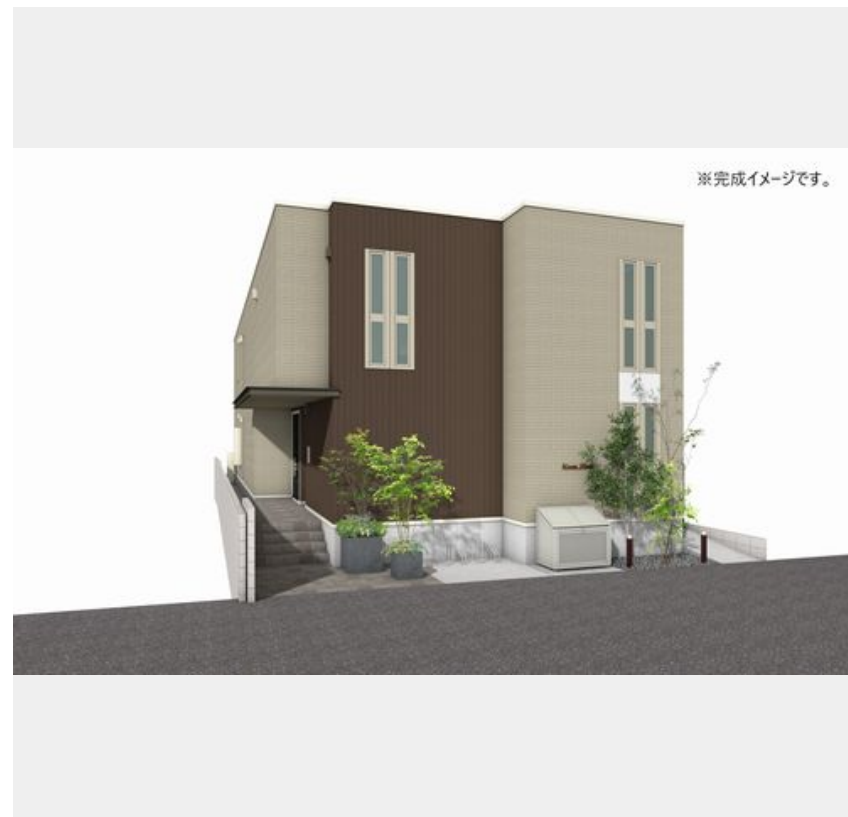
※完成イメージです。