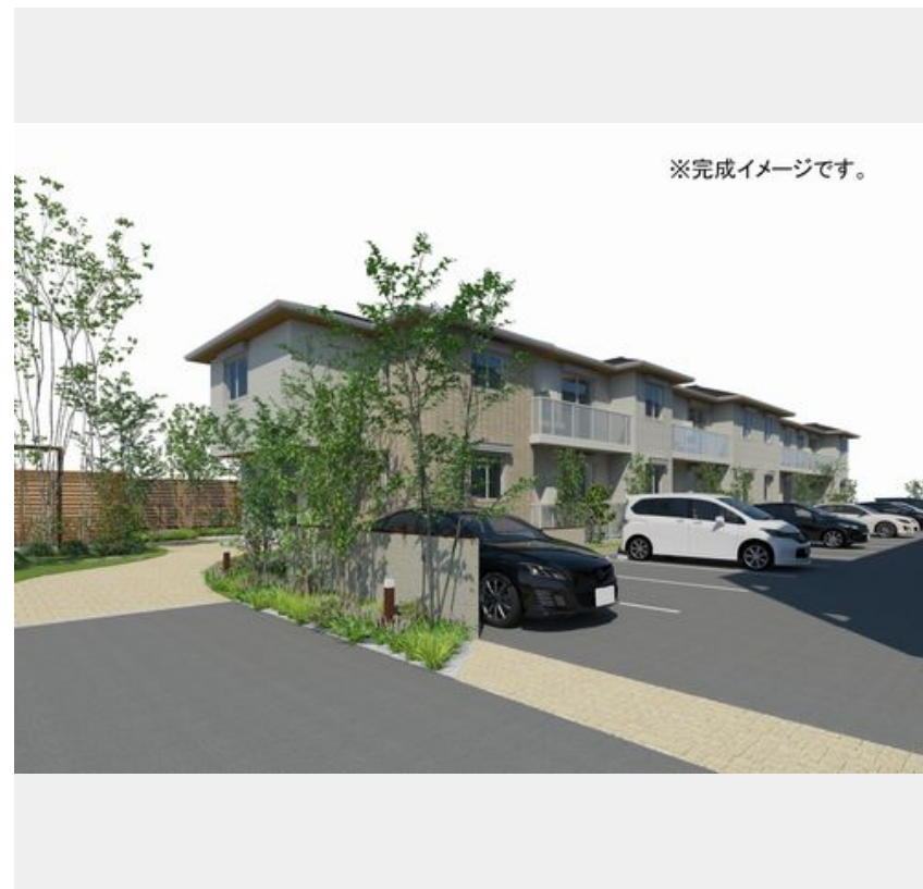
※完成イメージです。