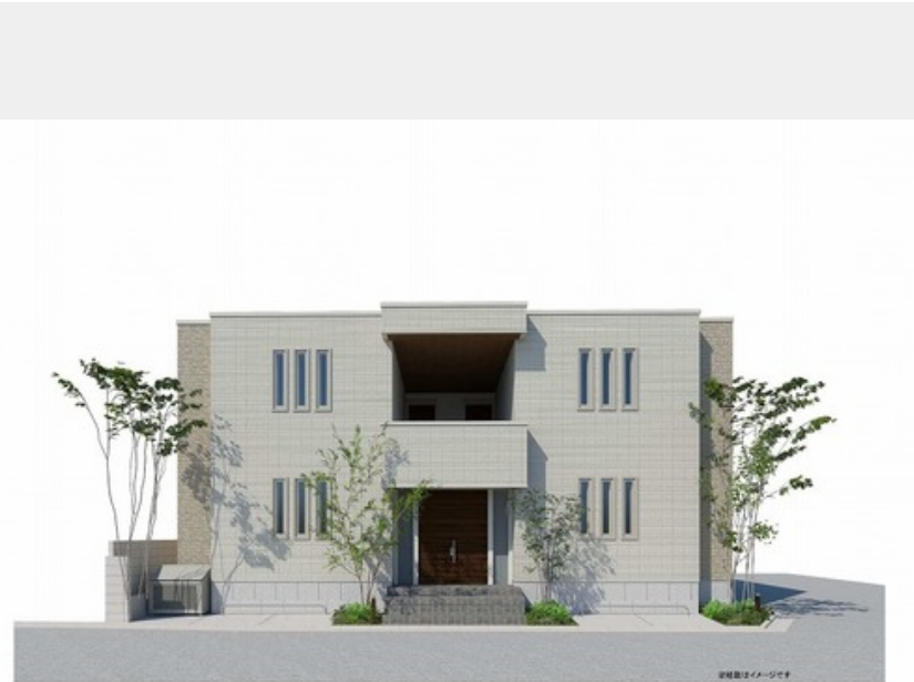
Lemans Chalet 完成予想図