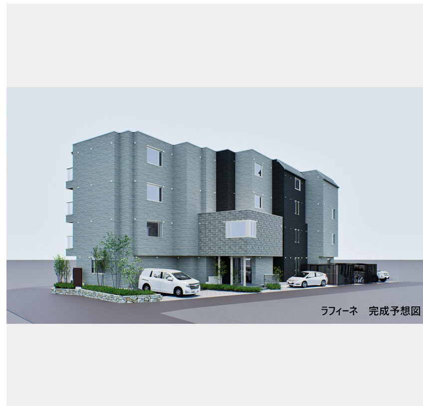
ラフィーネ 完成予想図