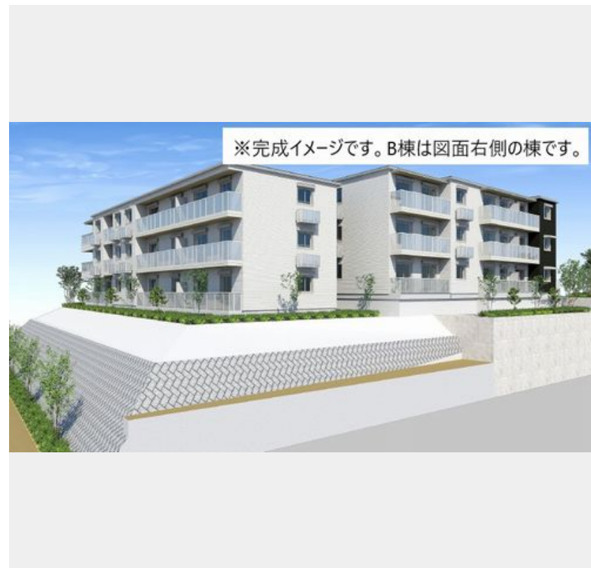
※完成イメージです。B棟は図面右側の棟です。