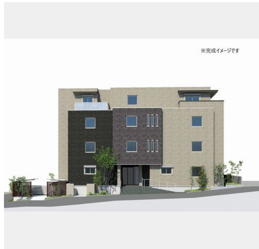
※完成イメージです