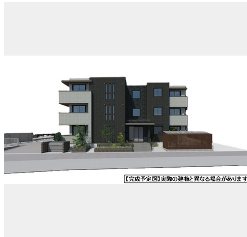
【完成予定図】実際の建物と異なる場合があります