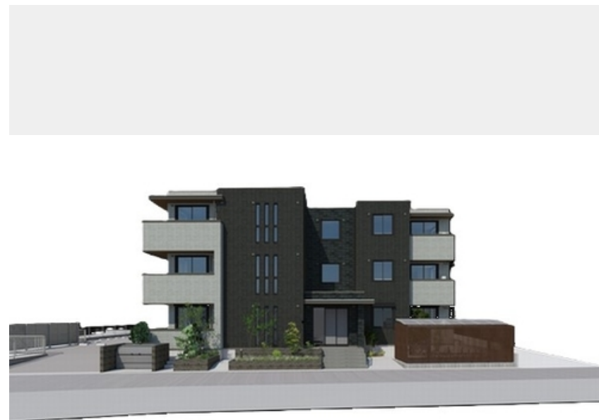
【完成予定図】実際の建物と異なる場合があります