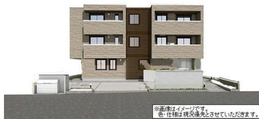
※画像はイメージです。色・仕様は現況優先とさせていただきます。