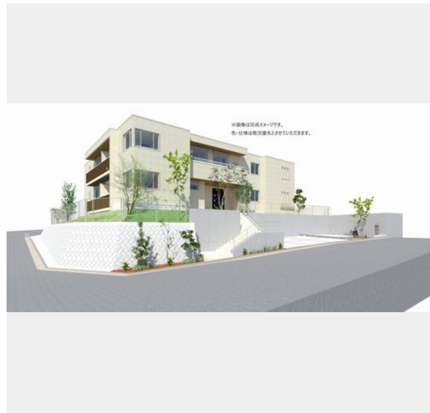
※画像は完成イメージです。色・仕様は状況優先とさせていただきます。