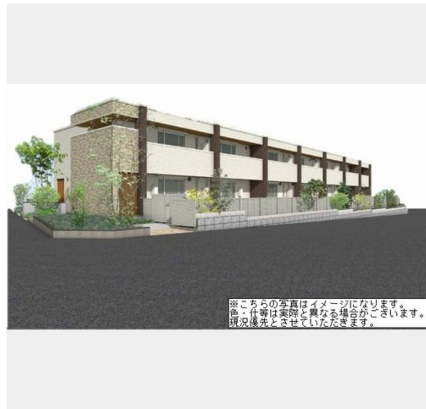
※こちらの写真はイメージになります。色・仕様は実際と異なる場合がございます。現況優先とさせていただきます。