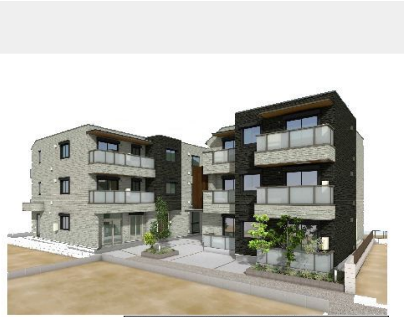
完成予想図です。実際の建物とは異なる場合がございます。また、絵图中的周辺環境・建物周り・植栽・空はイメージです。