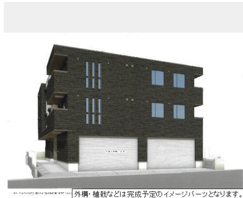
外構・植栽などは完成予定のイメージパーツとなります。