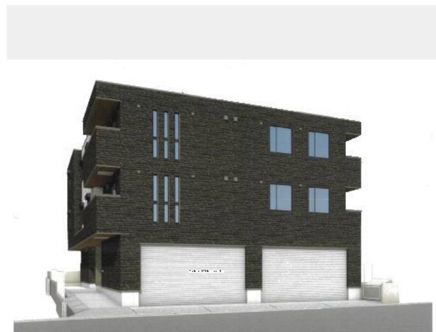
外構・植栽などは完成予定のイメージパーツとなります。