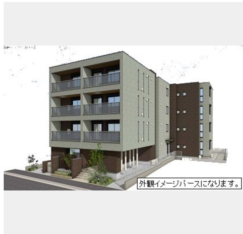
外観イメージパースになります。