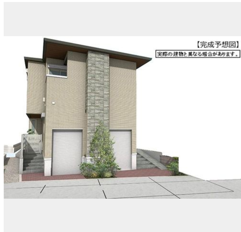
【完成予想図】 実際の建物と異なる場合があります。