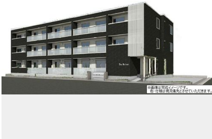
※画像は完成イメージです。色・仕物は現況優先とさせていただきます。