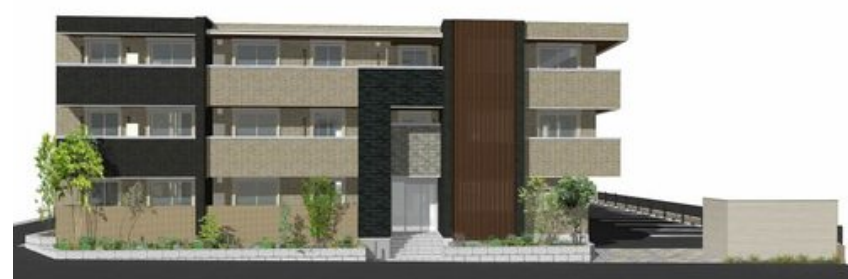
こちらに掲載のイメージイラスト等は、計画段階の図面を基に描き起こしたものであり、設計・施工上の理由により変更となる場合があることを予めご了承下さい。