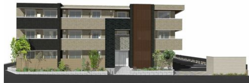
こちらに掲載のイメージイラスト等は、計画段階の図面を基に描き起こしたものであり、設計・施工上の理由により変更となる場合があります。ご了承ください。