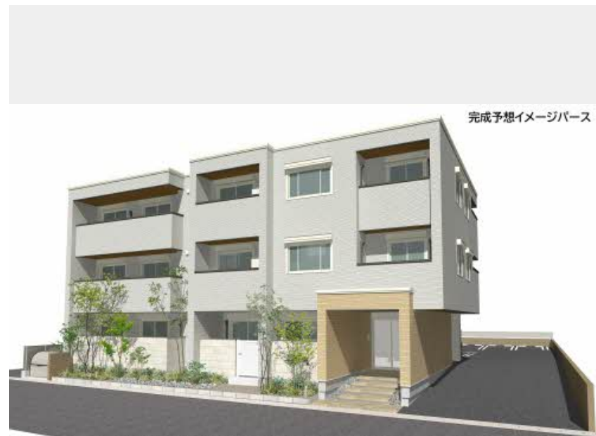
完成予想イメージパース

こちらに掲載のイメージイラスト等は、計画段階の図面を基に描き起こしたものであり、設計・施工上の理由により変更となる場合があることを予めご了承下さい。