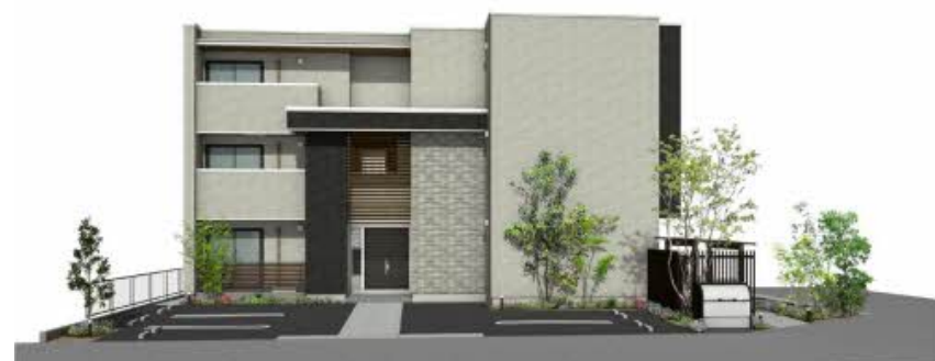
※写真は完成予想図です パースは実際の図面をもとに描き起こしたイメージで、実際のものとは異なる場合があります