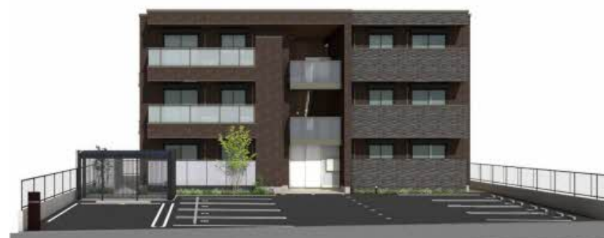
※写真は完成予想図です パースは実際の図面をもとに描き起こしたイメージで、実際のものとは異なる場合があります