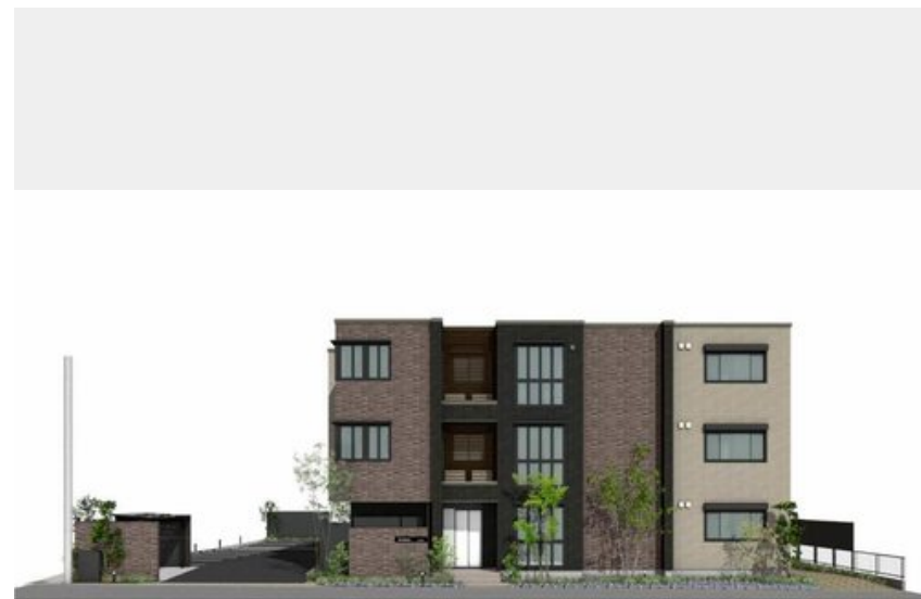
※写真は完成予想図です パースは実際の図面をもとに描き起こしたイメージで、実際のものとは異なる場合があります