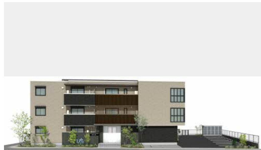
※写真は完成予想図です パースは実際の図面をもとに描き起こしたイメージで、実際のものとは異なる場合があります