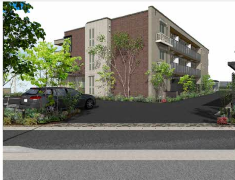
※写真は完成予想図です パースは実際の図面をもとに描き起こしたイメージで、実際のものとは異なる場合があります