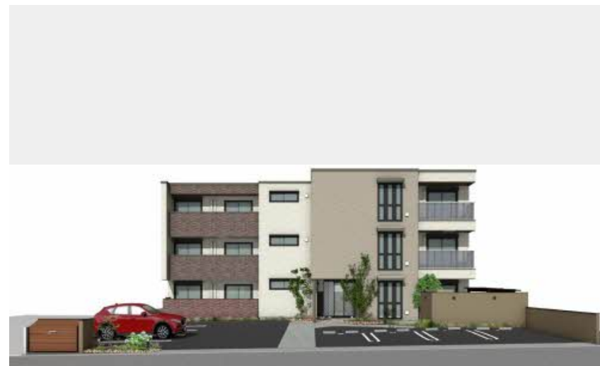
※写真は完成予想図です パースは実際の図面をもとに描き起こしたイメージで、実際のものとは異なる場合があります