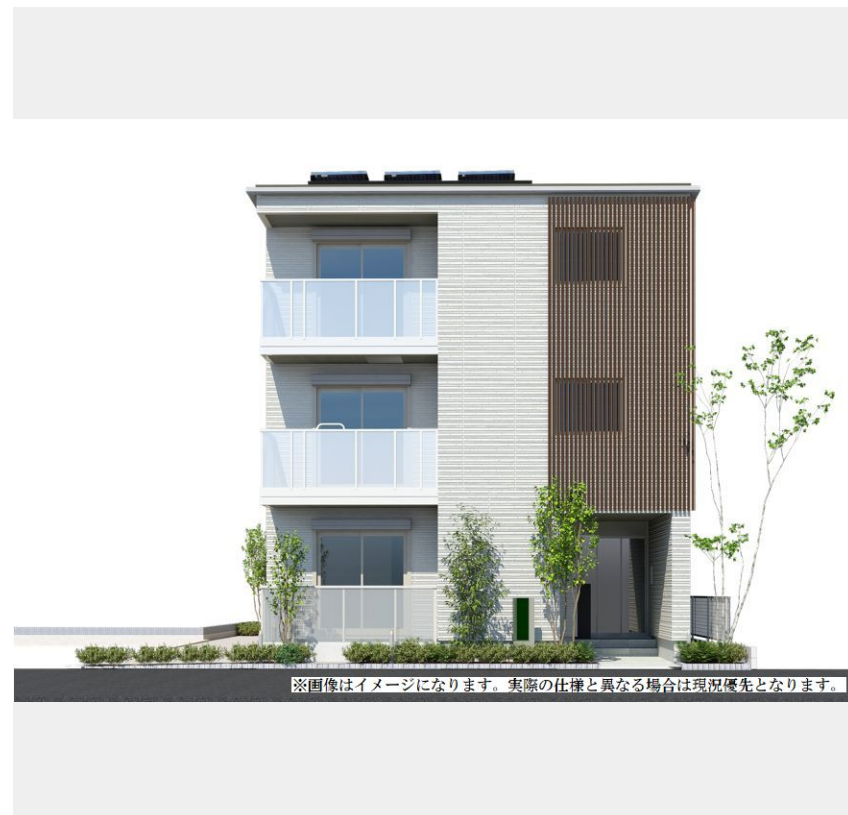
※画像はイメージになります。実際の仕様と異なる場合は現況優先となります。