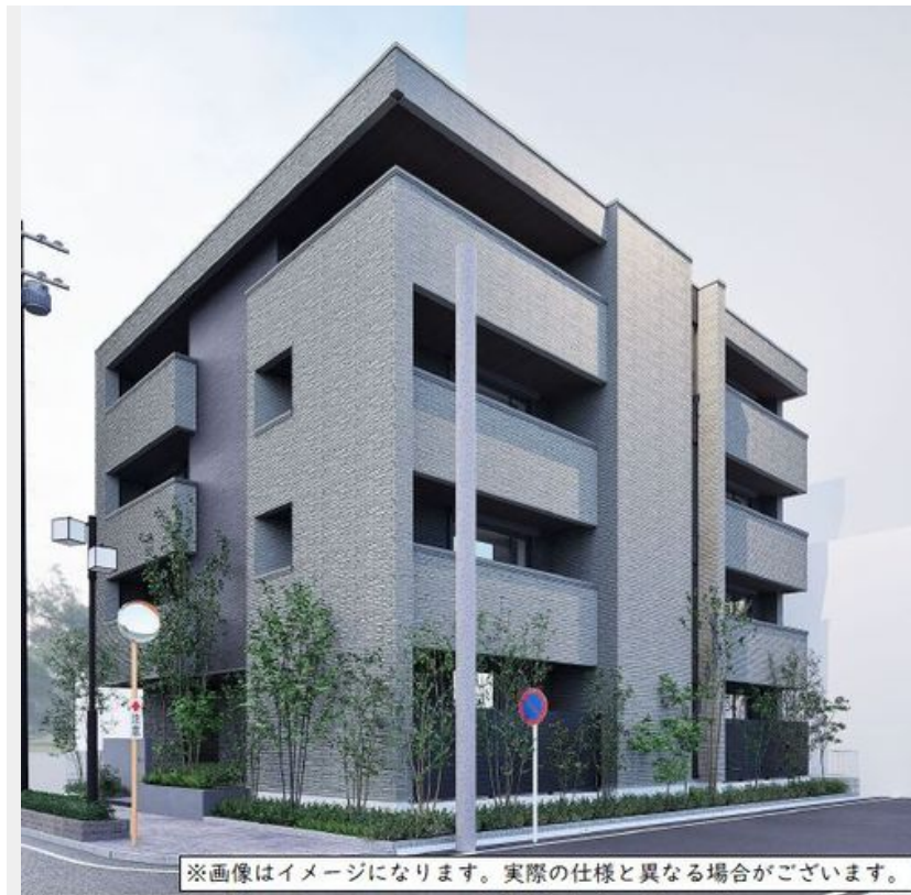
※画像はイメージになります。実際の仕様と異なる場合がございます。