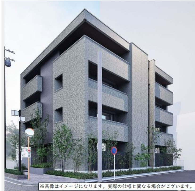
※画像はイメージになります。実際の仕様と異なる場合がございます。