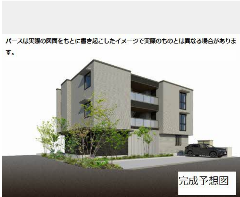
パースは実際の図面をもとに書き起こしたイメージで実際のものとは異なる場合があります。