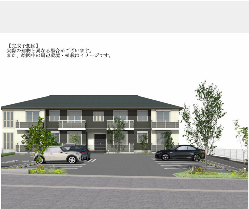
【完成予想図】 実際の建物と異なる場合がございます。 また、絵图中的の周辺環境・植栽はイメージです。