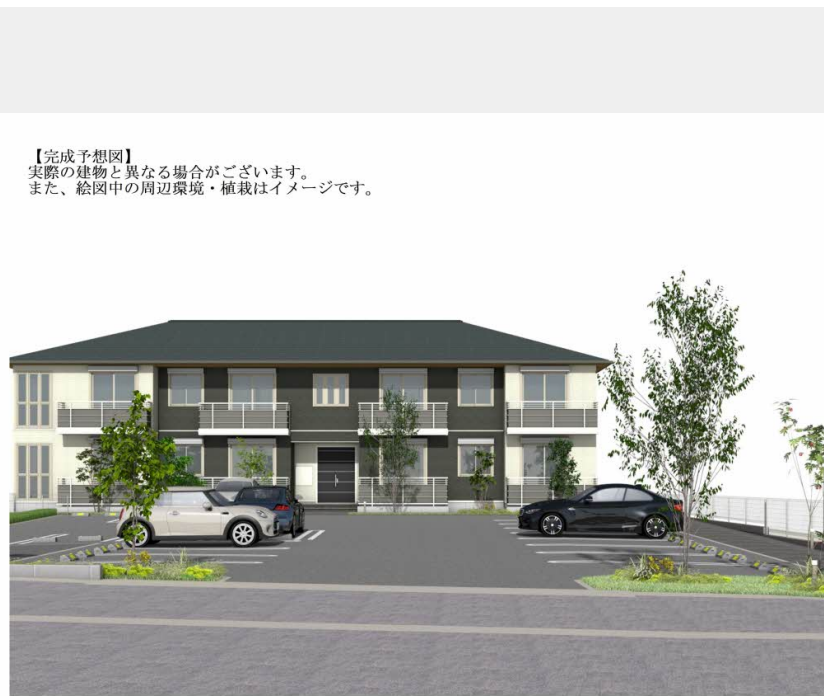
【完成予想図】 実際の建物と異なる場合がございます。 また、絵图中的の周辺環境・植栽はイメージです。