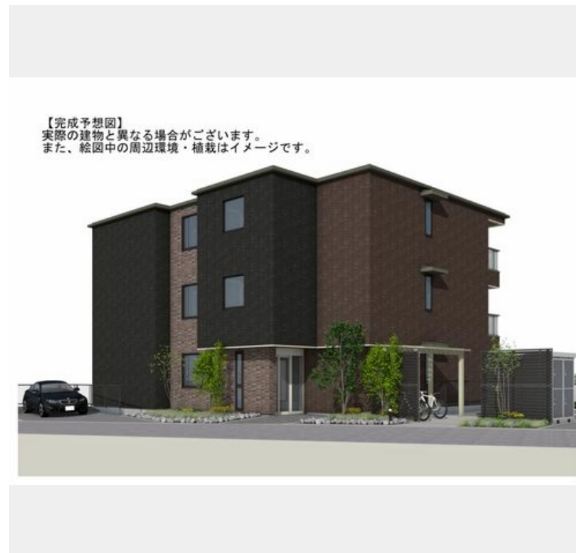
【完成予想図】 実際の建物と異なる場合がございます。 また、絵図中の周辺環境・植栽はイメージです。