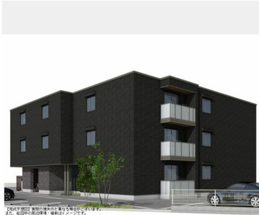
【完成予想図】実際の様子とは異なる場合がございます。また、絵図中の周辺環境・植栽はイメージです。