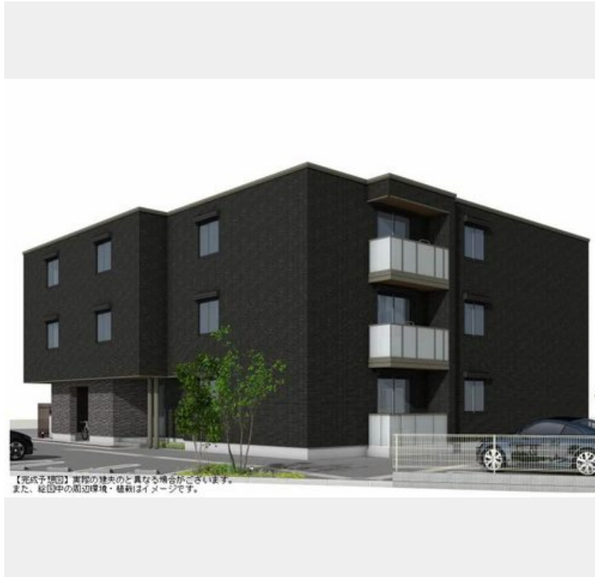
【完成予想図】実際の様子の異なる場合がございます。また、絵図中の周辺環境・植栽はイメージです。