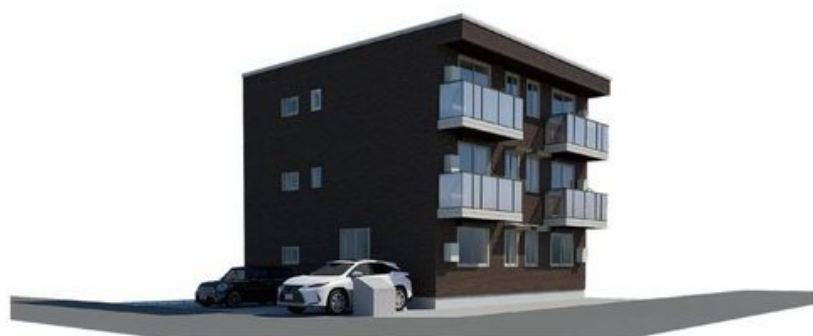
【完成予想図】実際の建物と異なる場合がございます。