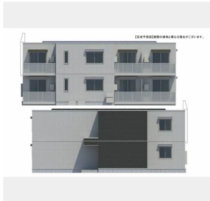
【完成予想図】実際の建物と異なる場合がございます。