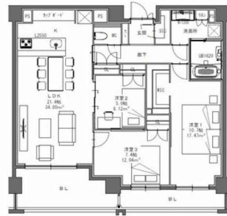
GGP 専有面積: 100.21㎡