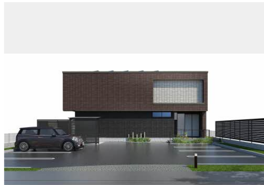
※写真は完成予想図です パースは実際の図面をもとに描き起こしたイメージで、実際のものとは異なる場合があります