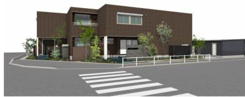
※写真は完成予想図です パースは実際の図面をもとに描き起こしたイメージで、実際のものとは異なる場合があります