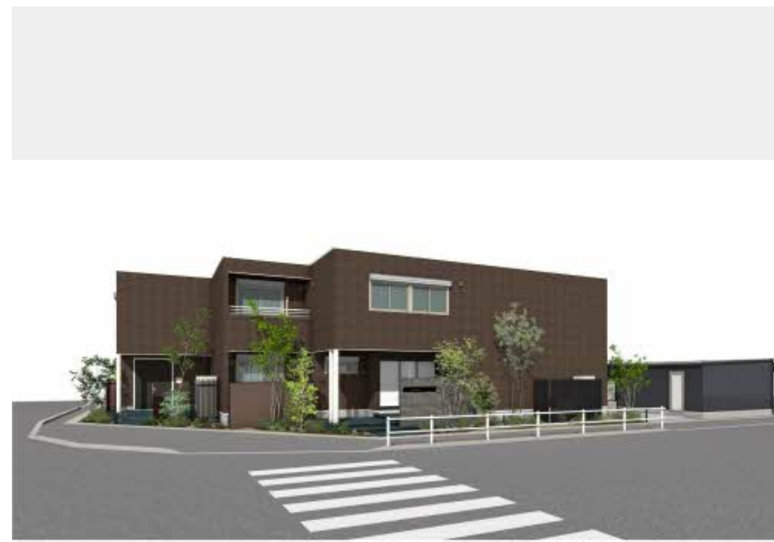
※写真は完成予想図です。パースは実際の図面をもとに描き起こしたイメージで、実際のものとは異なる場合があります。