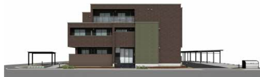
※写真は完成予想図です パースは実際の図面をもとに描き起こしたイメージで、実際のものとは異なる場合があります