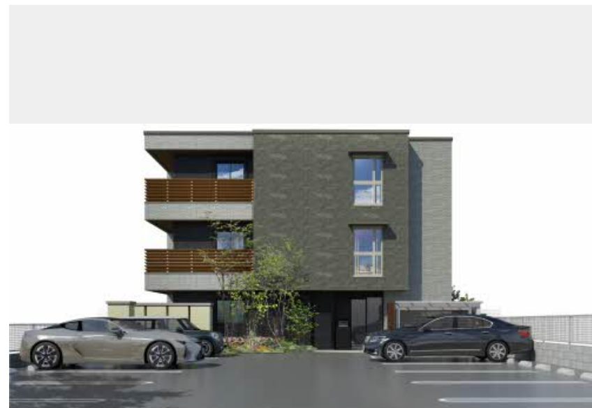
※写真は完成予想図です パースは実際の図面をもとに描き起こしたイメージで、実際のものとは異なる場合があります