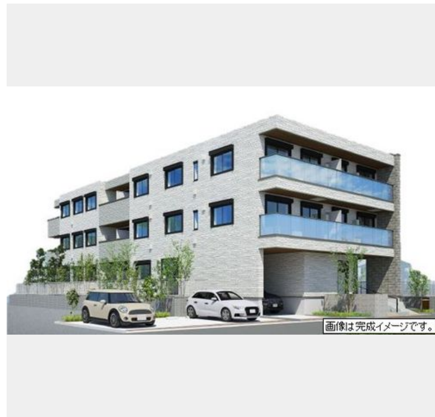
画像は完成イメージです。