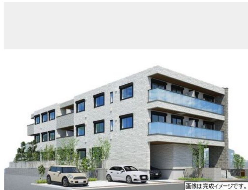
画像は完成イメージです。