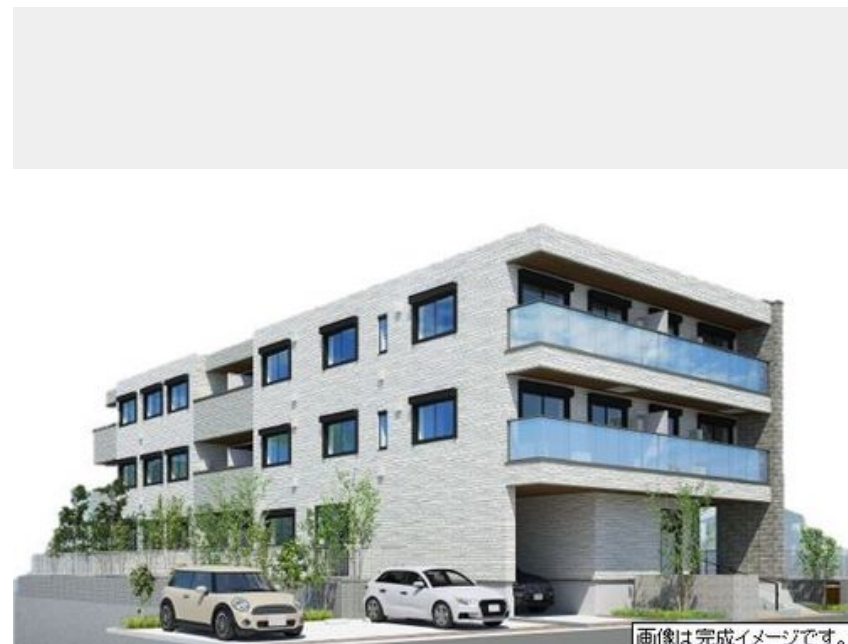
画像は完成イメージです。