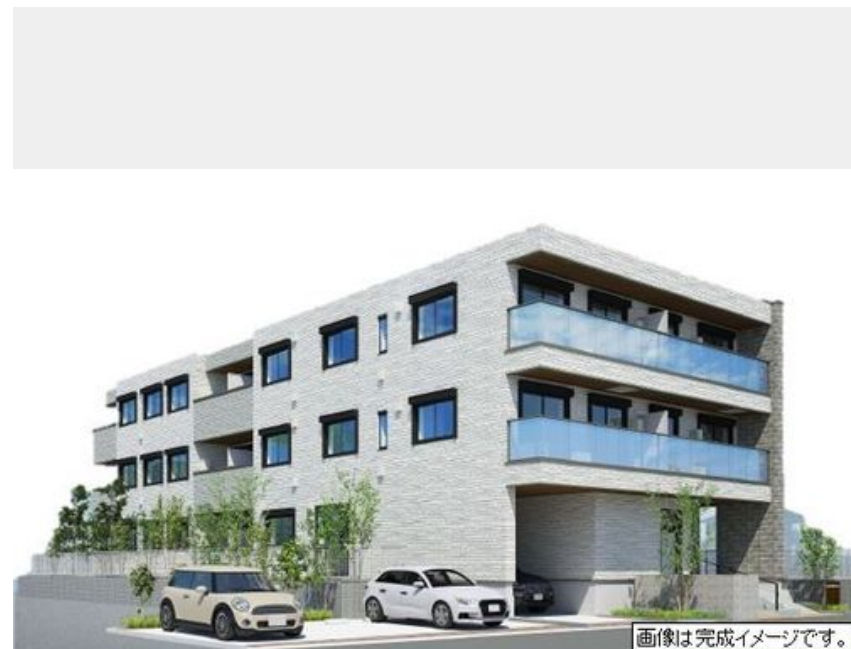
画像は完成イメージです。